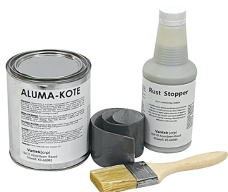
Набір для ремонту металу